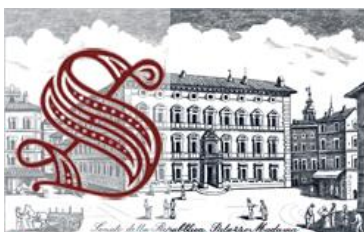
Senato della Repubblica »

(Notizie tratte dal sito del Ministero della Giustizia).