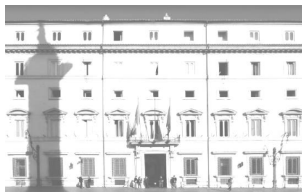
Governo - Ministero della Giustizia

Il Consiglio dei Ministri , venerdì 12 maggio 2017, ha approvato, in esame preliminare, tre decreti legislativi di attuazione della legge delega per la riforma del Terzo settore, dell'impresa sociale e per la disciplina del servizio civile universale (legge 6 giugno 2016, n. 106).